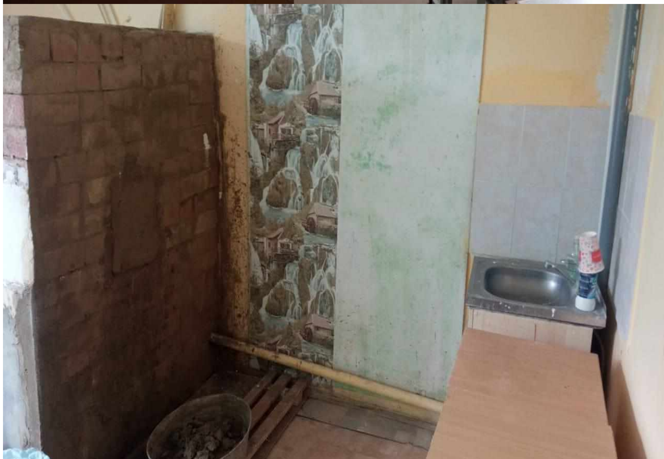
Уголок для практики нанесения штукатурки и оклеивания стен обоями.